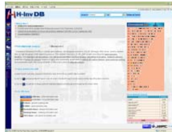
統合データベース: H-InvDB 2004年4月公開