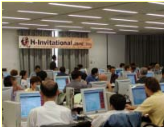
H-Invジャンボリー風景 (2002年8月)

生物情報解析研究センター(JBIC、産総研)およびDDBJ(遺伝研)が主催し、世界の 44研究機関からの120人以上の研究者 が参加した。